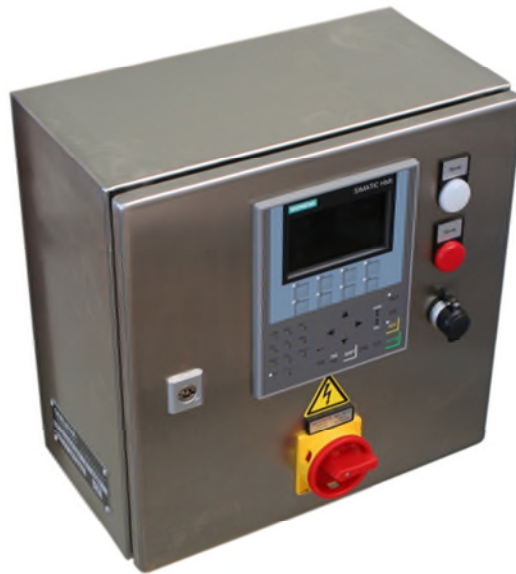
imagen: supervisión de la capacidad del flujo (unidad separada) con control Siemens para 4 circuitos de lubricante