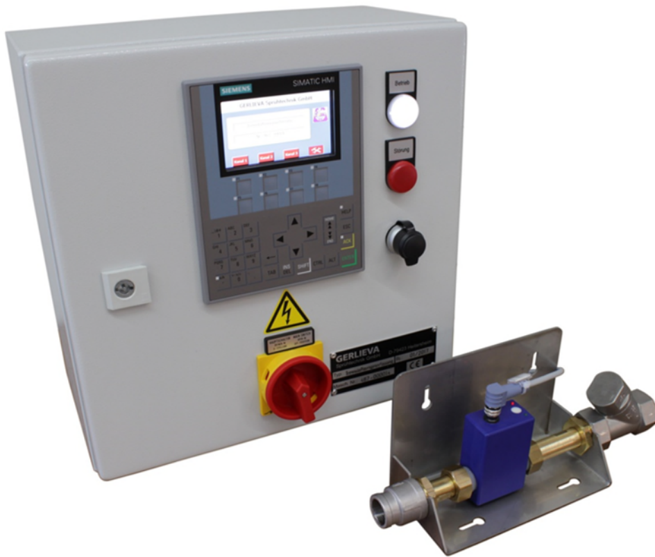
imagen: supervisión de la capacidad del flujo con control Siemens de hasta 8 circuitos de lubricante