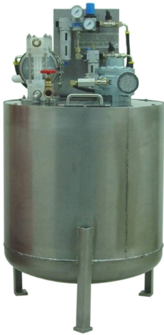
Abb.: Sprühmediumbehälter 50 Liter mit pneumatischem Rührwerk