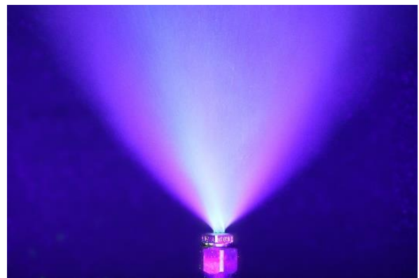
Foto: Sprühbild Dralldüse

Bleiben Sie immer informiert mit den News von GERLIEVA. Folgen Sie uns auf www.gerlieva.com und LinkedIn . März 2024 - Mit freundlichen Grüßen aus Heitersheim von Ihrem GERLIEVA Team